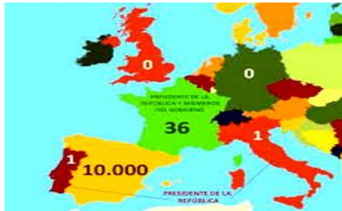
Figura. 1. Numero de aforados en los principales países de la UE sin incluir las Fuerzas de Seguridad.