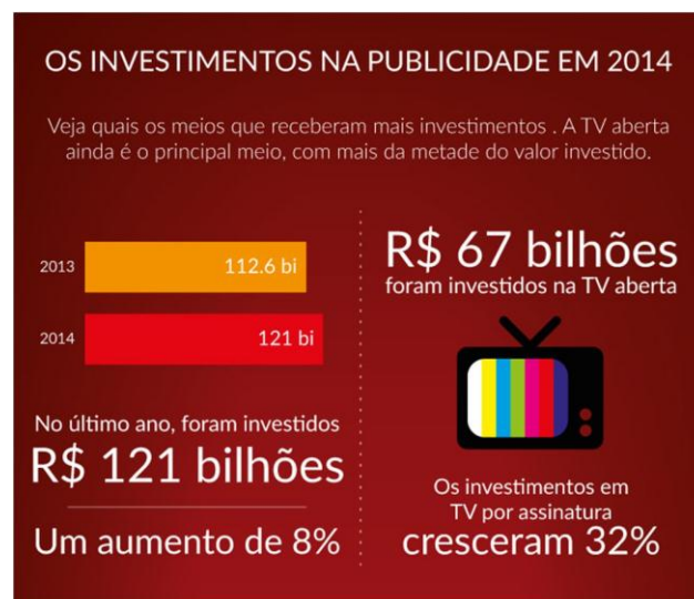
Figura 1 3

Decorrente do poder de consumo do brasileiro, o mercado se tornou um campo fértil para o setor publicitário, movimentando cifras bilionárias. Dados divulgados pela Revista Exame, no primeiro semestre de 2015, informam que o ano de 2014 o capital empregado na área cresceu o total de 8% (oito por cento) e as aplicações voltadas para a Televisão por assinatura superaram 30% (trinta por cento), o que comprova que cada vez mais se investe no poder de compra do consumidor.