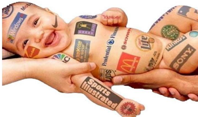
Figura 2 5

As criações publicitárias utilizam-se de personagens felizes, saudáveis e bem dispostos, com o objetivo de conseguir o encantamento do consumidor pela marca, o que elucida a imagem abaixo: